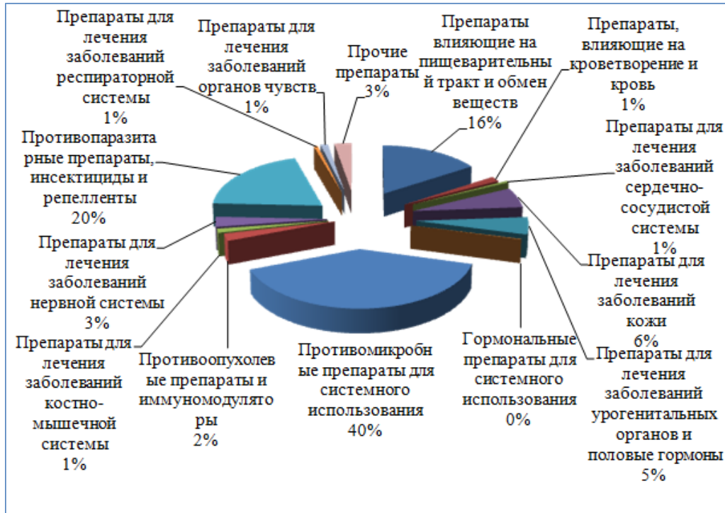
Рисунок 1 – Анатомо-терапевтическая-химическая классификация ЛС для ветеринарного применения

ном реестре в полном объеме, а некоторые группы (противомикробные лекарственные препараты (ЛП) для системного использования, занимающие 40%), возможно представлены в избытке [2].